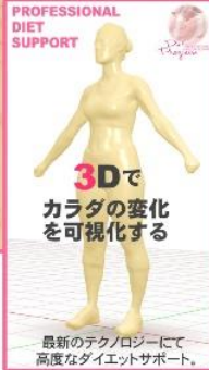
最新のテクノロジーにて高度なダイエットサポート。詳しくは裏面をご覧ください。

NEW 高精度ダイエットプログラム 50% OFF ※3ヶ月コース通常4,980円 ▶2,490円